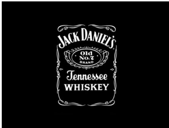
Băuturi: Coca Cola, Jack Daniel's

Consiliul Superbrands pentru România a fost format în 2010 din 30 de personalități, reprezentând membri marcanți ai mediului de afaceri, specialiști din industria de comunicare și mass media. Din totalul brandurilor evaluate de către Consiliu, doar 60% au fost acceptate pentru a intra în cercetarea de piață condusă de către Nielsen la scara națională, pe un eșantion de 1000 de subiecți , cu vârsta cuprinsă între 19-54 ani. 300 de branduri din aproape 25 de domenii de activitate s-au calificat pentru statutul de Superbrand 2010.